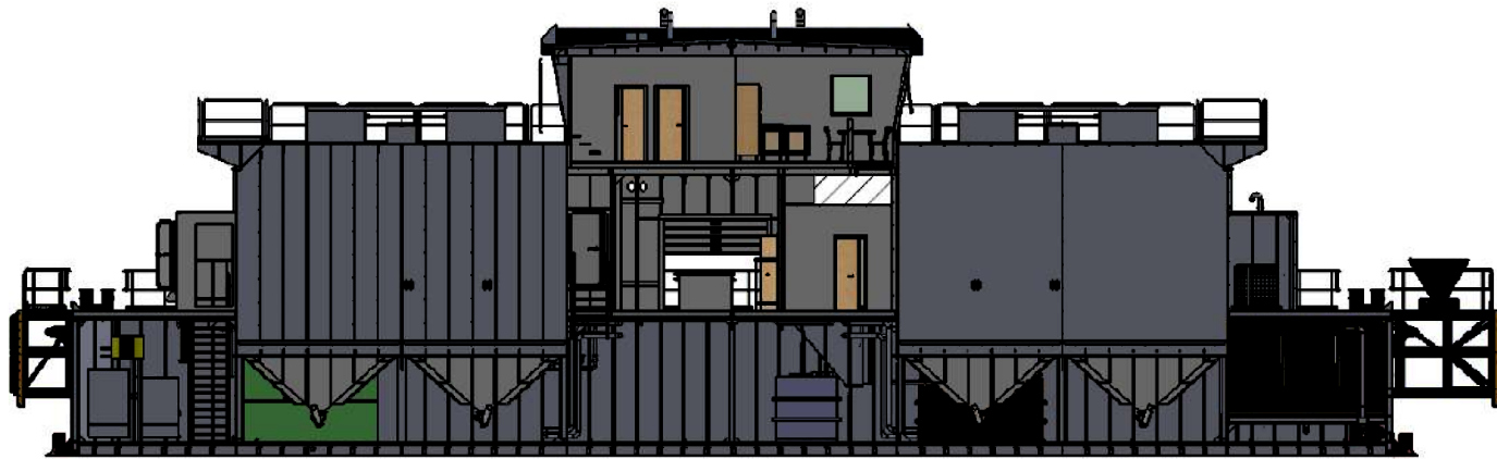
SECTION K-K SCALE 1 : 125