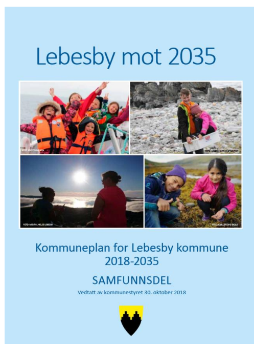
Figur 2-1 Kommuneplanens samfunnsdel

Denne planstrategien er utarbeidet parallelt med revisjon av kommuneplanens samfunnsdel. Normalt er det i planstrategien politikerne skal ta stilling til om kommuneplanen skal revideres. For å gjøre prosessen så effektiv som mulig og sørge for å få en ny samfunnsdel på plass tidlig i inneværende kommunestyreperiode, vedtok politikerne å starte opp arbeidet med samfunnsdelen før ny planstrategi var på plass. Dette fulgte opp anbefalinger både fra administrasjonen og forrige kommunestyre. Ny planstrategi planlegges vedtatt i oktober 2024, mens ny samfunnsdel forventes endelig vedtatt i desember 2024.