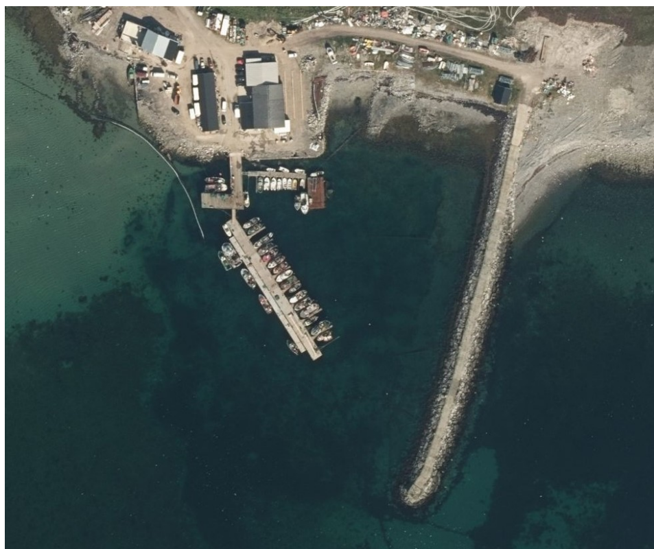
Bilde fra Veidnesklubben, hvor tilsvarende flytekai er plassert i almeningskaia. Denne har uttriggere, og dermed plass til flere båter.

Lebesby kommune har (den 5. mai) søkt Finnmark Fylkeskommunes Havbruksfond og (den 7. mai) søkt RUP-midler til prosjektet. Da vi var usikre på hvilke av fondene det var mulig å få tilskudd fra, valgte vi å søke begge steder. Etter dialog med fylkeskommunen får kommunen bekreftet at det i følge retningslinjene kan innvilges inntil 50 % fra fylket, og at søknaden vil bli behandlet i henhold til RUP-midlene. Dette er likevel en skjønnsvurdering,