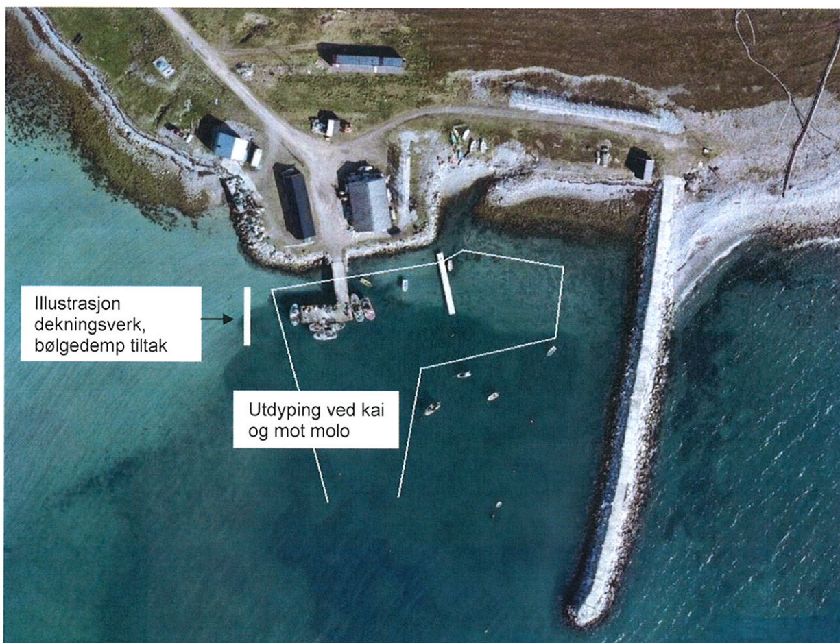
Fig.1. Flyfoto av Veidnes kai og molo.

Som flyfoto viser er det en opphopning av masser på kaias vestside som skaper problemer ved kai. Det er lagt ut bunnkjetting parallelt med moloen. Opprinnelig hadde denne 9 opphalere da den lå på østsiden av moloen (før mudring), men det er ikke kjent om denne har samme lengde i dag. Bunnkjettingen vil bli tatt opp før mudring.